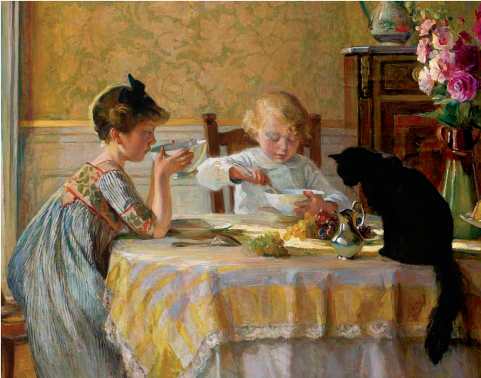
Angèle Blanche Denvil, Snack Time (1913).